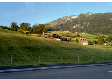
Blick von der Toggenburgerstrasse